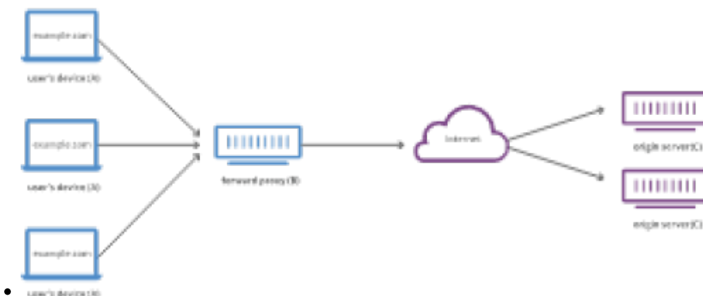
Forward Proxy Flow